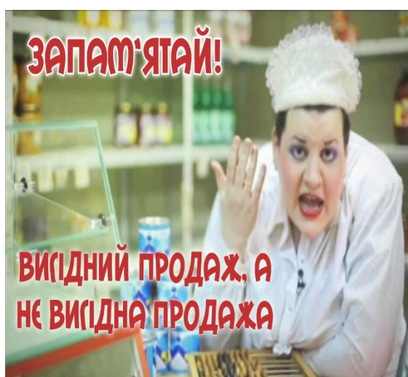
Рис. 3. Рід іменника «Продаж»