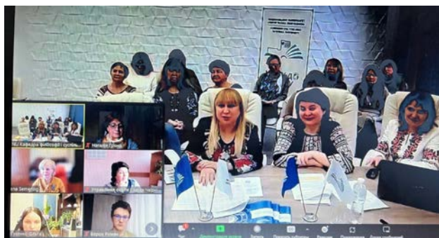
Рис. 4. Скрін світлини із мережі «Фейсбук»

– III Всеукраїнська науково-практична інтернет-конференція «Стан, проблеми та перспективи розвитку мовно-літературної освіти в умовах реалізації продуктивної освітньої стратегії» (лютий 2023 року);