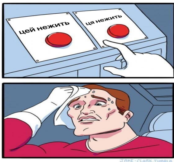
Рис. 2. Рід іменника «Нежить»

У ході такої роботи здобувачі освіти коригують власне мовлення, формують культуру спілкування, уміння доречно й точно формулювати та висловлювати думки. Культура мовлення, спілкування є невід'ємними складниками загальної культури особистості та найважливішим показником освіченості. Медіатексти є ретрансляторами як, власне, фактів, так і міркувань про ці факти, за допомогою тих виражальних засобів, які здатні тим чи іншим чином вплинути на свідомість слухача або читача. Залежить від того, як ми сприймаємо інформацію, як діємо після її усвідомлення.