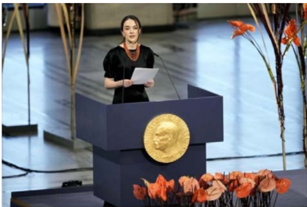
Рис. 1. Скрін світлини

як визнання зусиль всього українського народу, що сміливо виступив проти спроб зруйнувати мирний розвиток Європи, та як відзначення важливості роботи правозахисників у попередженні військової загрози в усьому світі. Ми пишаємося, що сьогодні вперше українська мова прозвучить на офіційній церемонії.